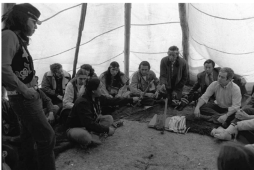
Wounded Knee 1973: onderhandelingen in een tipi, met aan het woord Leonard Crow Dog (met pijp), rechts van hem op de foto Dennis Banks, Russell Means en Wallace Black Elk en daarnaast de Amerikaanse regeringsvertegenwoordigers.

In dit nummer kijken we terug, en dat is dus niet alleen met verhalen, maar ook met veel beelden. Geniet ervan – en de volgende keer weer in actie voor de indianen van nu.